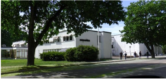
Ett nyrenoverat Joar en möjlig anhalt i ett turiststråk.

Hamnen är också en del av Enköpings turistverksamhet. Vi vill utveckla hamnen så att den blir ett attraktivt besöksmål för båttureturister i Mälaren. Hamnområdet bör också utvecklas mot att kunna erbjuda uppställningsplatser, med tillhörande service, för husbilar.