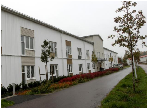
Kommunens nya omvårdnadsboende i Bredsand.

arbetsmiljö och reducerar antalet sjukskrivningsdagar.