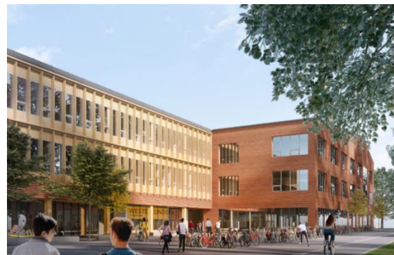
Nya WGY beräknas vara klart 2024.

Ett övergripande mål för den kommunala verksamheten är att skapa bra förutsättningar för långtidsarbetslösa Enköpingsbor att klara sin egen försörjning och leva ett bra liv. Gör vi det på ett bra sätt påverkas också kommunens ekonomi positivt.