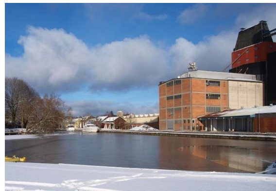
Vårt hamnområde med energiverket har stor potential.

Ett område som har en stor potential är hamnområdet. Moderaterna vill frigöra området från industriell verksamhet och utveckla det till en inbjudande miljö för boende, rekreation och mötesplats. Hamnområdet bör länkas samman med Drömparken/Joar Blå och centrum genom naturliga gång och cykelstråk. En fråga som kommunen äger och där en förutsättningslös lösning måste fram är Ena Energi framtid. Även om det 2021 har fattats ett inriktningsbeslut om flytt av anläggningen senast 2035 så är frågan om framtiden i övrigt olöst. Moderaterna är för en snabb förutsättningslös utredning för att få svar på vad som är bästa lösningen, att sälja, delförsälja eller behålla i kommunal regi.